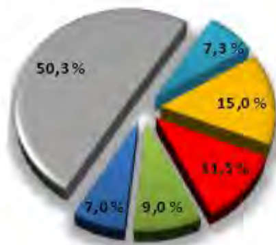
Crimes contra o património- 218.236

No que diz respeito ao Relatório Anual de Segurança Interna (RASI 2012), de 2011 para 2012 o total de crimes contra o património diminuiu , igualmente, 4,4% , passando de um registo de 228.261 crimes em 2011 , para 218.236 crimes em 2012 . De entre estes o destaque vai também para o furto em veículo motorizado (15%) e para o furto em residência com arrombamento ou escalonamento (11,5%) .